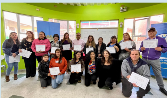
Ceremonia de cierre de año en la sede San Antonio. Enero 2024