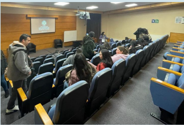
Primera examinación Gran Concepción. Agosto, 2023.