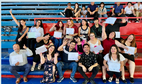
Ceremonia de cierre de año en la sede San Felipe. Enero 2024