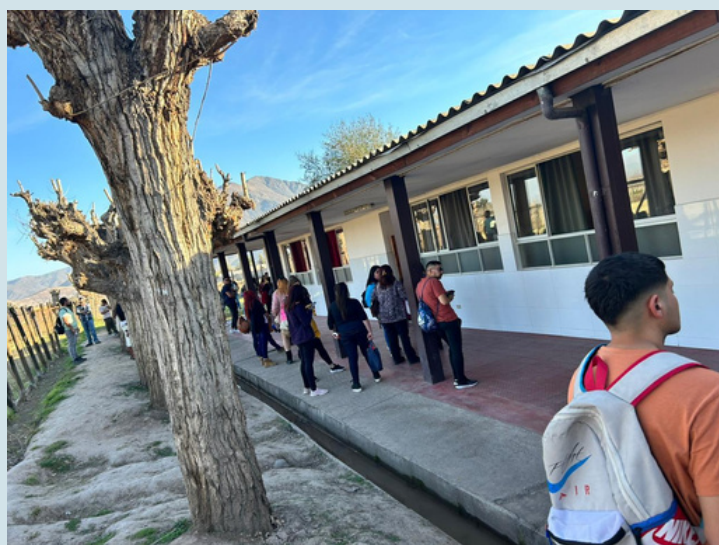
Primera examinación sede San Felipe. Agosto, 2023.