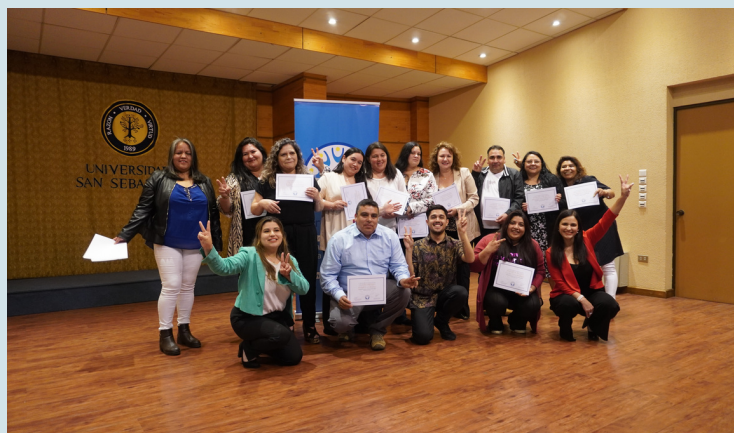
Ceremonia de cierre de año en la sede Gran Concepción. diciembre 2023.