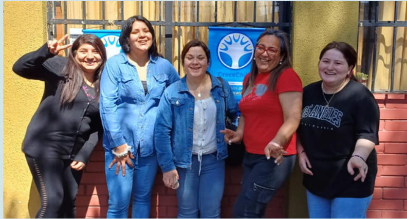
Tercera examinación en la sede La Florida. Noviembre, 2023.