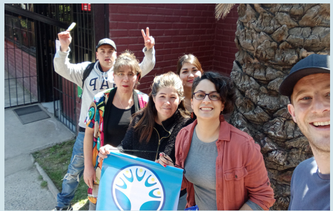
Segunda examinación sede Quilicura. Octubre, 2023.