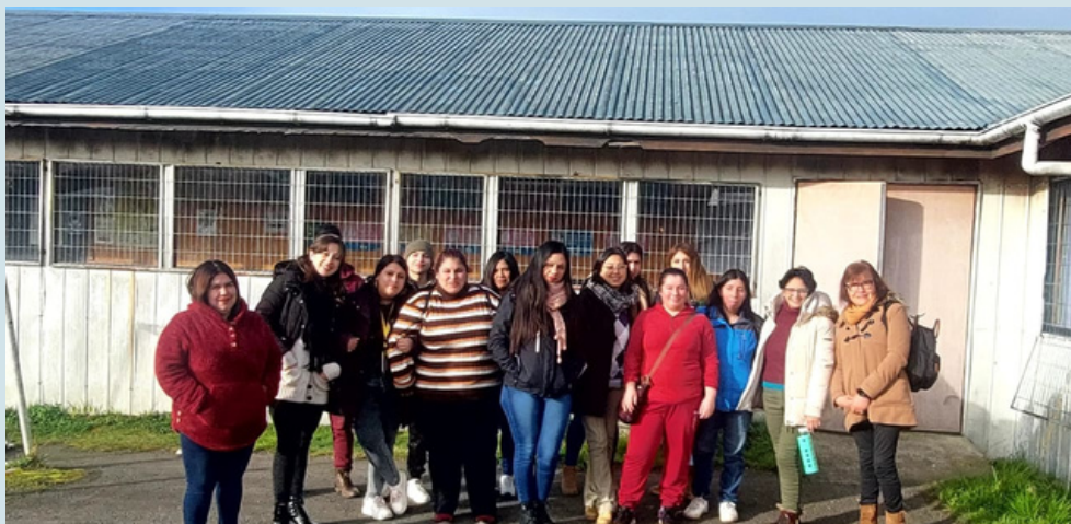
Primera examinación Quellón. Agosto, 2023.