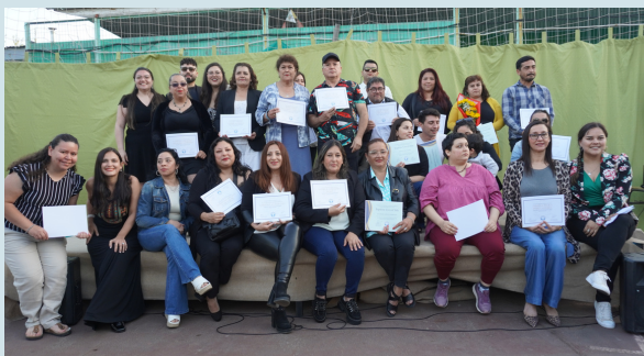
Ceremonia de cierre de año en la sede Gran Valparaíso. Enero 2024