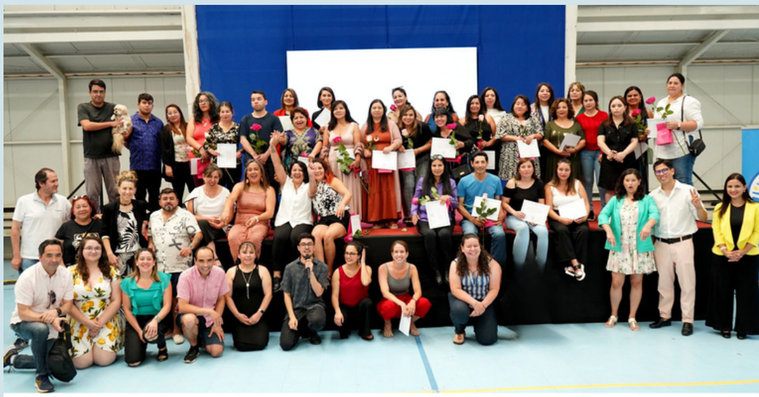
Ceremonia de cierre de año en las sedes de La Florida y Quilicura, Región Metropolitana, enero 2024.

Sabemos que volver a estudiar es un desafío complejo, pero también tenemos claro que vale la pena y el esfuerzo. Sus risas y sueños, las que han compartido con nuestras coordinadoras de sede, tutores, voluntarias y el equipo de gestión, son el motor para entregar lo mejor que tenemos para apoyarlos en este desafío.