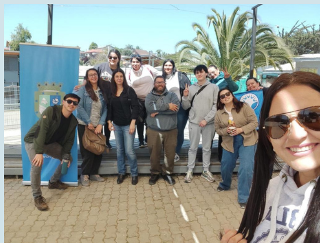
Segunda examinación en la sede del Gran Valparaíso. Agosto, 2023.

No tan solo estuvimos presentes a través de tutorías o resolviendo sus dudas, sino que también los acompañamos en sus rendiciones de exámenes y entrega de resultados, las que se realizaron en los meses de agosto, octubre y noviembre.