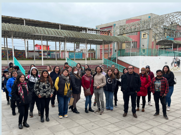
Primera examinación sede Antonio. Agosto, 2023.