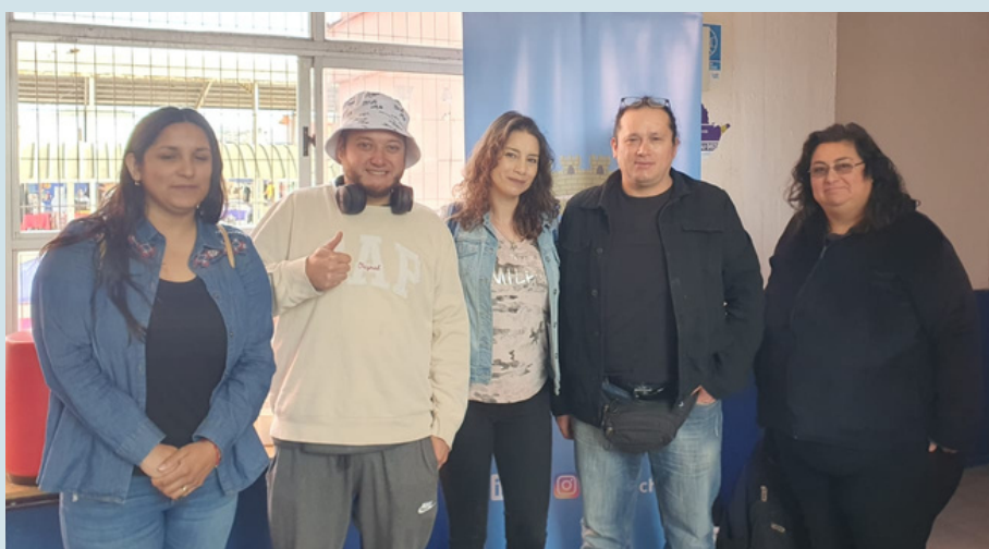
Equipo de vinculación y acompañamiento en la última examinación de nuestros estudiantes en San Antonio el 2023

“Ha sido un poco complicado para uno por la cantidad de años que uno lleva sin estudiar, pero el apoyo ha sido fundamental. Hemos podido aprender y hemos avanzado en este proceso. Estamos dándole todo el esfuerzo y seguir estudiando nomás”.