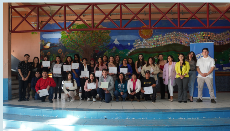
Ceremonia de cierre de año en la sede Quellón. diciembre 2023.