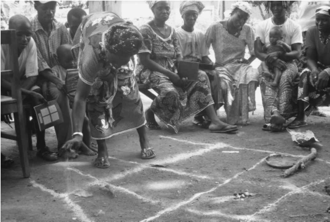
AFAB Círculo Reflect

Empacado de la fibra de coco