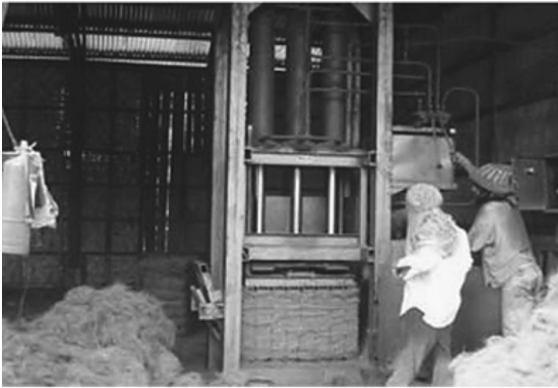
Matinao Centro de arroz